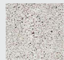
HELLGRAU roh strukturiert oder geschliffen, poliert