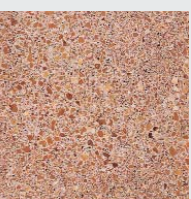
ROSA roh strukturiert oder geschliffen, poliert