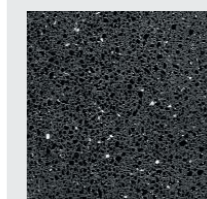
SCHWARZ roh strukturiert oder geschliffen, poliert